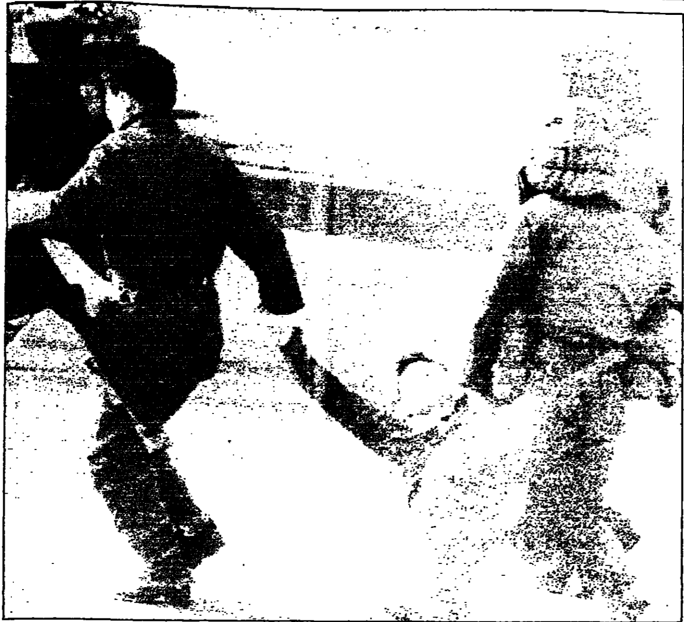
رائد شرطة كوري جنوبي يصرخ من الألم فيما يحمله زملاؤه خلال المصادمات مع الطلبة المظاهرات في سيول امس .